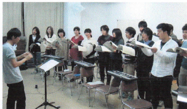
定期演奏会に向けて練習に励む現役部員(府立大学第一音楽室にて)